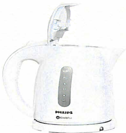
Начальник А-НПС-4 Должность